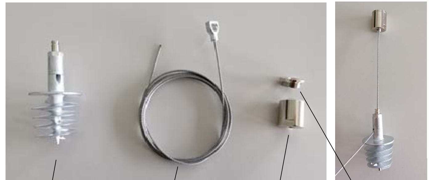
Stockschraube mit integriertem Seil-Schnellversteller Stair bolt with rope-quick adjuster

Use the integrated rope-quick adjuster of the stair bolt to revise the suspension height.